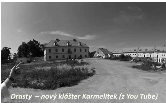
Drasty – nový klášter Karmelitek (z You Tube)

Kromě průběžných a pokračujících úkolů jednání probralo zejména program následujících týdnů (viz dále rubrika Co je před námi ). Dále byly diskutovány také možnosti návštěvy sester Karmelitek v Drastech a další farní pouti.